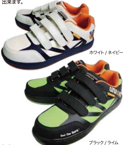
ホワイト/ネイビー

メッシュ素材を使用した完全防水セーフティースニーカー。4時間4cm防水で雨の日でも安心して作業が出来ます。