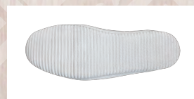
底部分は滑りにくい合成ゴム底を使用