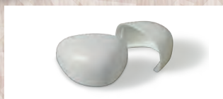
つま先部分には樹脂先芯入り