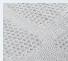
通気抜群のニット素材 伸縮性がありストレスフリー