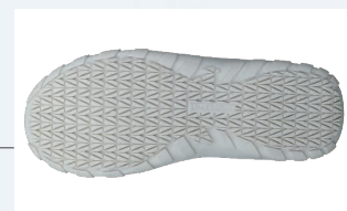
滑りにくいオリジナル底意匠 耐滑区分4を実現