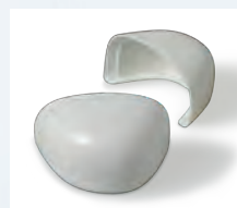
つま先部分には樹脂製先芯を 使用し、軽量かつ安全