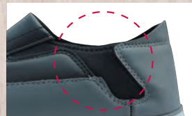
脱ぎ履きしやすいよう、かかと部に伸縮性があるネオプレン素材を使用