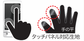
手の平 タッチパネル対応生地

親指・人差し指にタッチパネル 対応生地を採用。手袋を着用 したままで操作が可能。