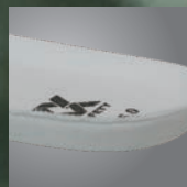
EVA カップインソール