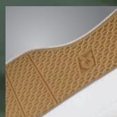
滑りにくいオリジナル合成ゴム底