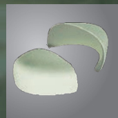
つま先部分は樹脂先芯入