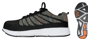
GR-7 / Black×Orange