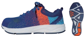
GR-6 / Blue