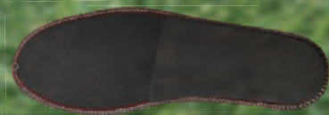
疲れ軽減 EVA クッション中敷き使用