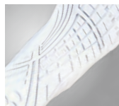
滑りにくいオリジナル 合成ゴム底