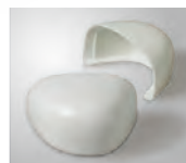
つま先部分は樹脂先芯入